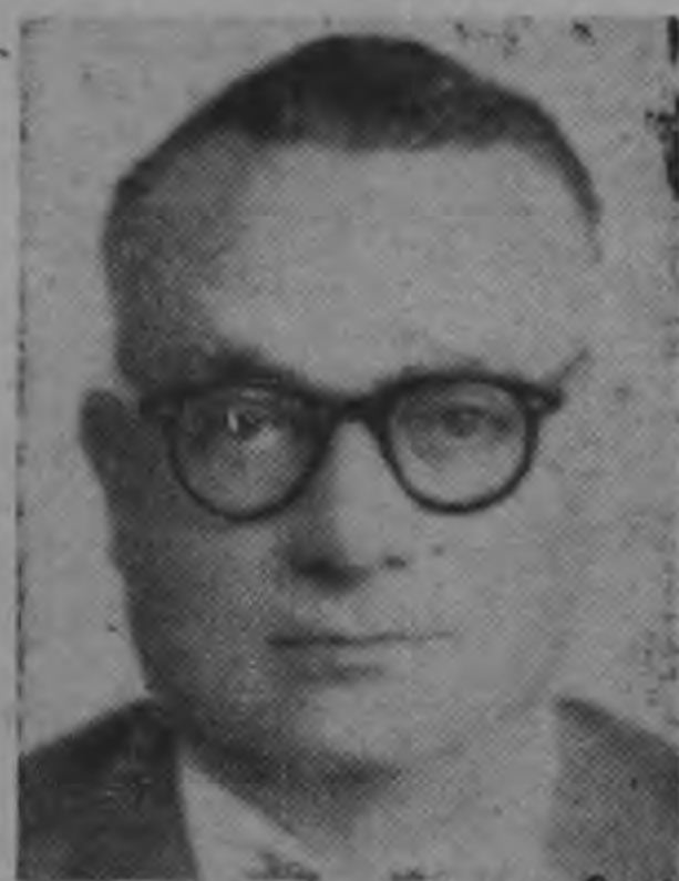
ROMULO BETANCOURT ...una solución electoral...

El Canciller de Nicaragua Oscar Sevilla Sacasa en declaraciones para la prensa nacional e internacional manifestó "su extrañeza" por la decisión del gobierno vecino. Y anunció que la disputa ha sido sometida a la Organización de Estados Centroamericanos (ODECA) — (TEXTO EN PAGINA 24) —