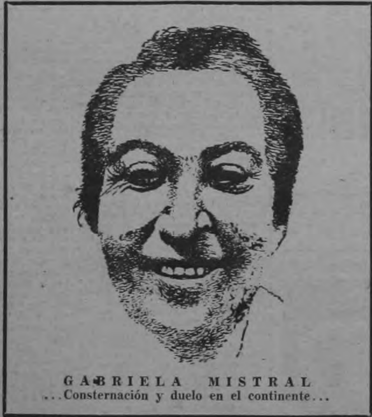
GABRIELA MISTRAL ...Consternación y duelo en el continente...