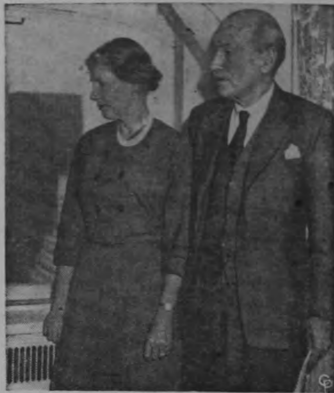
El ex-Primer Ministro laborista Clement E. Attlee de Inglaterra, ahora Conde de Attlee y Lady Attlee, contemplan los rascacielos de Nueva York desde su hotel. Lord Attlee que está en los Estados Unidos para un recorrido de tres semanas de conferencias dijo a los periodistas que él espera que el Partido Laborista controlará el gobierno británico en las próximas elecciones generales y elogió la nueva política de Eisenhower respecto al Medio Oriente.